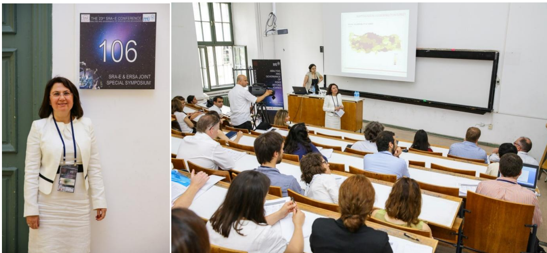
Joint Special Symposium of SRA-E and ERSA on 'Resilience of Regions in the Face of Risks', 16-18 June 2014, Istanbul

The Joint Special Symposium on 'Resilience of Regions in the Face of Risks' realized with presentation of 12 papers in 3 sessions on Socio-Spatial Vulnerability and Resilience of Regions; Disaster Governance and Regional Adaptation Strategies, and Urban Vulnerability and Resilience Planning. The Joint Special Symposium has been attractive and provided a high level of participation. The large audience has had a great contribution to a nice discussion during the Symposium.